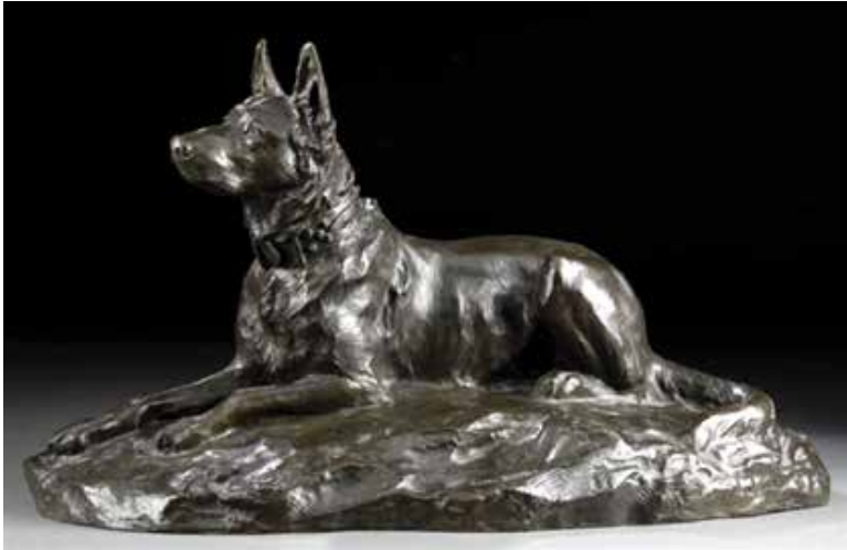
Malinois couché – Bronze de Jean Joire (Lille)