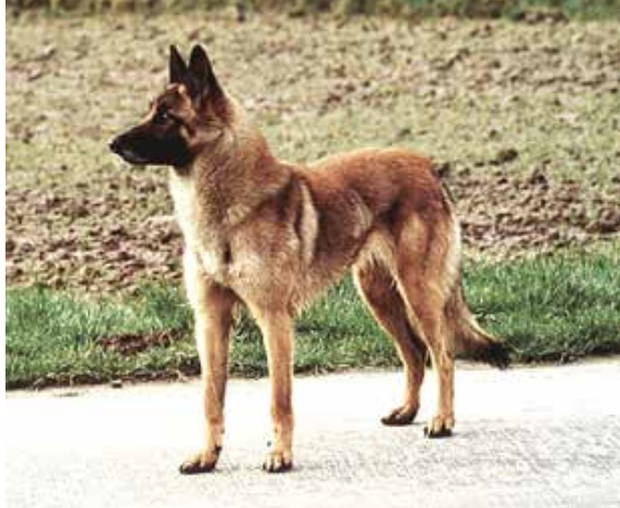
G'Lady (ALSH 33186), 24 avril 1982 - 20 mars 1996

Son doux pelage toujours aimais de caresser et ses belles allures jamais me lassais d'admirer.